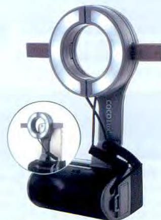
標準価格 ¥24,000 (税別)

今回ご紹介させていただく商品は、オカベの「COCO Lux スマートライトココルクス」です。この商品の3つの特徴としましては