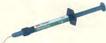
2g 標準価格 ¥2,500 (税抜)

直接修復の「ベース・ライナー」と間接修復の「レジン築造」に最適なフロアブルレジンです。重合収縮応力は弊社従来品フロアブルレジンと比べ約 50%少なくなります。硬化深度は1回の光照射で4mmまで重合可能です。支台歯に対して近い距離で操作できることに加え、押し出し圧は弊社従来品と同程度であることからコア築造などの作業に適しております。