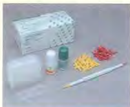
セット標準価格 ¥9,400 (税抜)

BioUnion テクノロジーはジーシーが長年培ってきたガラスイオノマーのテクノロジーを発展させたテクノロジーで、塗布面に亜鉛イオン、フッ化物イオン、カルシウムイオンを放出します。2液を混和し歯面に塗布することでクリスタル粒子層が形成され、露出した象牙細管を封鎖し、知覚過敏を抑制します。クリスタル粒子層は、塗布後の歯ブラシによるブラッシングや酸性にかたむいた口腔内においても、歯面に残り象牙細管を封鎖するため、知覚過敏の抑制効果が持続します。