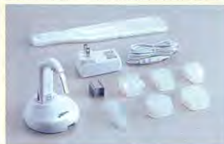
セット標準価格 ¥29,800 (税抜)

お手持ちのメガネにも簡単装着可能な充電式のコードレス LED 照明器です。照度 20,000 lx の LED ライトが目線に合わせた角度でピンポイントで照らすため、上顎口蓋側や臼歯部遠心まではっきりと見えます。照射角度は上方向に 15 度、下方向に 30 度まで自由に調節可能です。4 段階でバッテリー残量を常に確認でき、フル充電で約 3 時間半の連続使用が可能です。最大約 20mm の開口量があるので、多くのメガネに工具なしで装着可能です。(保証期間は 1 年。)