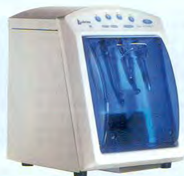
標準価格 ¥230,000 (税別)

医療器材の洗浄・消毒・滅菌といった「院内感染予防対策」は先生方はもとより、ハンドピース滅菌記事が新聞等で報道されてから一般的な人々も高い関心を寄せるようになってまいりました。ハンドピースに関しましては、ご存知のようにオートクレーブ滅菌の前にはハンドピースの注油・洗浄が必須となっております。これを確実に行わないとハンドピースの寿命が短くなったり、又、余分なオイルが原因では？と思われるオートクレーブのトラブルも起きています。